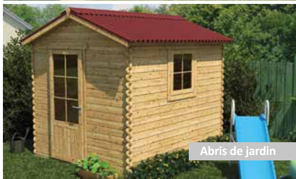
Abris de jardin